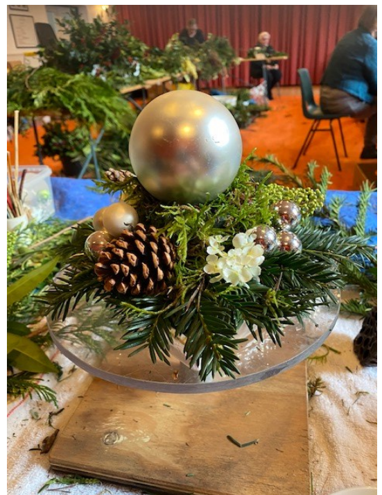
De rijke gaven uit Hengelvele van de oogstdankdag